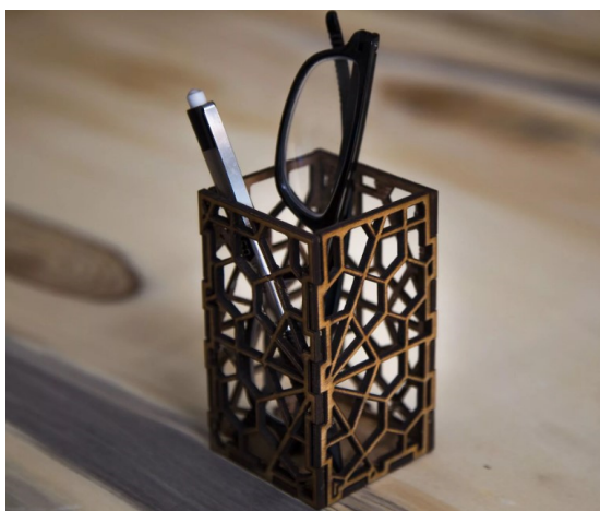
(Рис.1) Карандашница (органайзер)